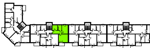
LOKALIZACJA MIESZKANIA W BUDYNKU - 3 PIĘTRO