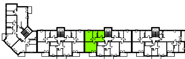
LOKALIZACJA MIESZKANIA W BUDYNKU - 3 PIĘTRO