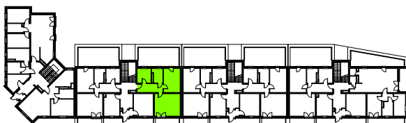
LOKALIZACJA MIESZKANIA W BUDYNKU - PARTER